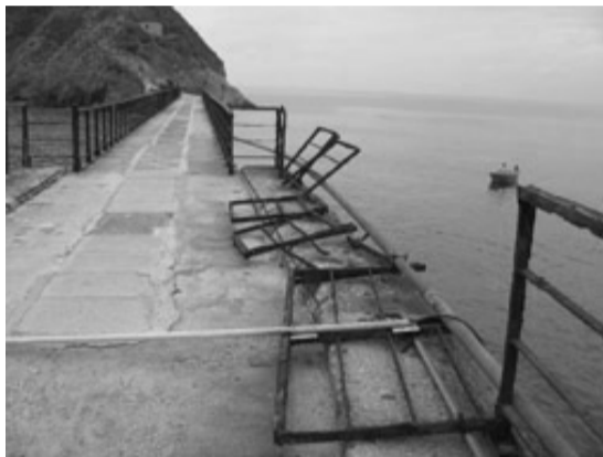
Il ponte nelle attuali condizioni

Si uniscono a tale appello le personalità d'alto livello scientifico e culturale, così come i rappresentanti del mondo ambientalistico, i quali sollecitano in tal senso le autorità competenti, ed esprimono l'augurio che quell'unicum di bellezza e armonia ch'è Vivara (biotopo già individuato dal Progetto Bioitaly tra i S.I.C. - Siti di Importanza Comunitaria), rimasto miracolosamente intatto,